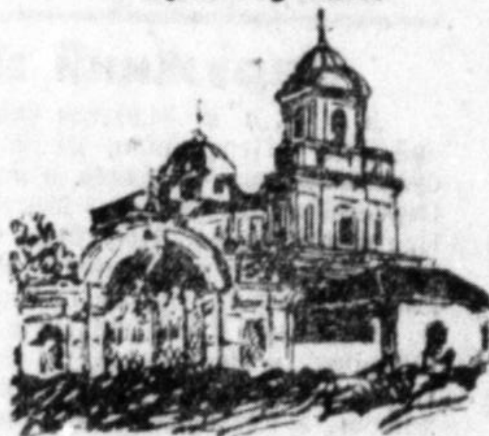
Православний собор в Луцьку. (Гляди статтю на стор. 4-й).