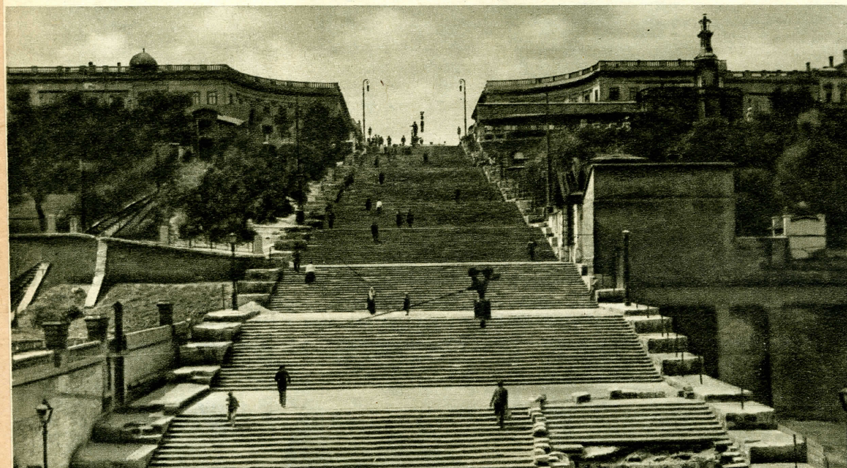
A híres odesszai lépcsősor.

Most, kéthónapos kemény ostrom és a bolsevisták által végrehajtott nagyarányú pusztítások után, Odessza valószínűleg romokban hever.