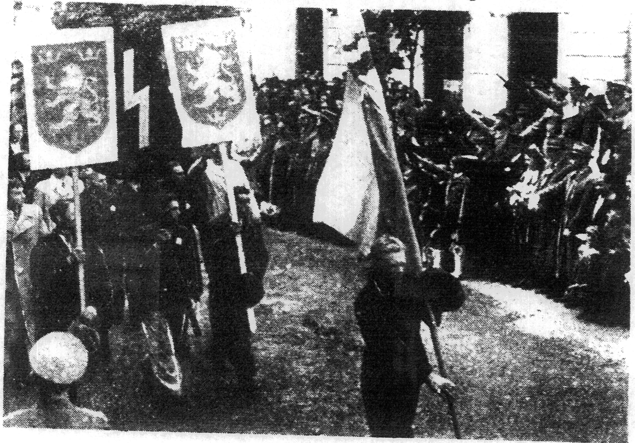
23-го травня ц. р., відбулася величава маніфестація добровольців СС Стрільцької Дивізії Галичина в Коломиї. На свідлині: Добровольці проходять почесним ходом перед Губернатором Галицької Области Д-ром О. Вехтером і його почетом.