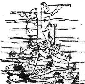
Війна проти жінок і дітей

щодня жвавий рух. Масово зголошуються працівники Делегатур, установ, студенти і учні фахових шкіл, учителі і селяни — як колишні військовики, так і новобранці. З кожним днем кількість добровольців дуже зростає так, що можна сподіватись, що Бережанщина не лишиться позаду найсвідоміших повітів.