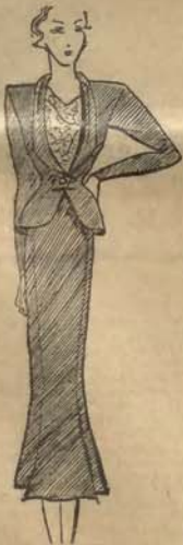
Model Nr. 1.

Natemnat spacerowe suknie ozdobił awami, jak: mankiety, kamizelki, szerokie kołnierze i wyłogi starsza się zbliżyć do tailleuru i przybrał bardziej męski charakter. W obecnej modzie zakłada się dawne granice, i „wymiana” linii, konturów i przybrań jest bardzo ostrożna. Syzyk stroju nie na tem ale traci, przeciwnie, wiele zyskuje, jak to widzimy na załączonych rysunkach.