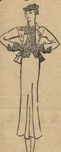
Model Nr. 5.

Sąd Najwyższy wydał doniesienie dla handlu orzeczenie w sprawie weksli in blanco. Sąd Najwyższy wyjaśnił, że dopuszczalne jest powołanie dowodu ze świadków na stwierdzenie, iż weksel in blanco został wypełniony przez posiadacza weksla niezgodnie z wolą wystawcy. Dla obrótów gospodarczych orzeczenie to ma doniosłe znaczenie. Dotychczas dłużnik wekslowy narazył się w braku dokumentu