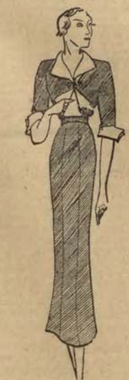
Model Nr. 3.

Efektowne wyłogi szokujące są w rzeczywistości kołnierzem bluzki, wyłożonym na zakładkę; bluzka zrobiona jest z jedwabnego „madras” w różnokolorowe kraty.