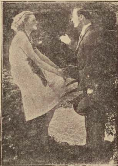
Brigida Helm i Georg Aleksander w wielkim filmie dźwiękowym, w którym główną postać gra nasz rodak Jan Kiepura.