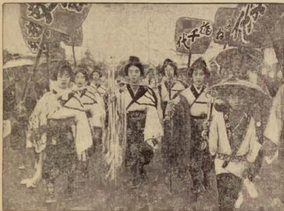
Malowniczy pochód geisz ulicami Tokio w dniu Wielkiego święta Mikada.